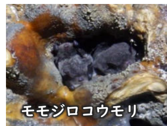
モモジロコウモリ

7名のボランティアでケイビングガイド研修を行いました。ルート確認とモモジロコウモリ・ユビナガコウモリなど洞窟の生き物を観察しました。