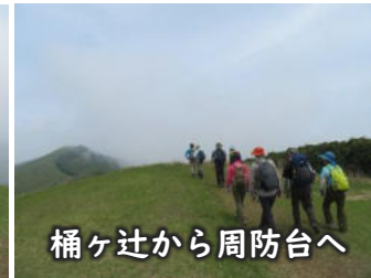
桶ヶ辻から周防台へ