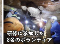
研修に参加した8名のボランティア