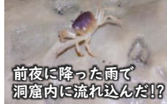
前夜に降った雨で洞窟内に流れ込んだ!?