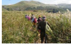
本日の最高峰「岩山」