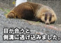
目が合うと側溝に逃げ込みました。