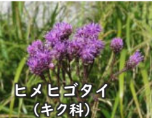
ヒメヒゴタイ (キク科)