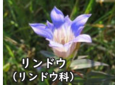
リンドウ (リンドウ科)