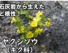
石灰岩から生えたど根性!