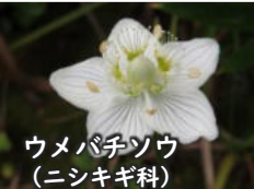
ウメバチソウ (ニシキギ科)