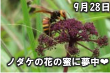
ノダケの花の蜜に夢中♡