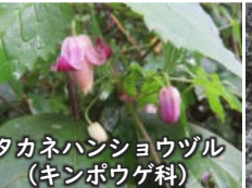
タカネハンショウヅル (キンポウゲ科)