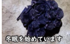
冬眠を始めています